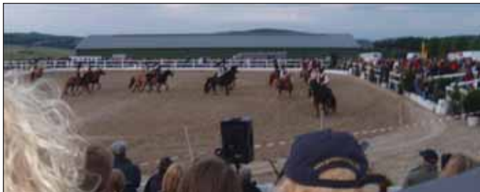
In der Abenddämmerung zeigten die Isländer ihre Schaunummer.