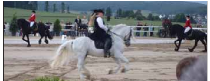
Rassige Schönheiten, die Friesen vom Team Fröhlich. Mit der Rarität: einem weißen Friesen.